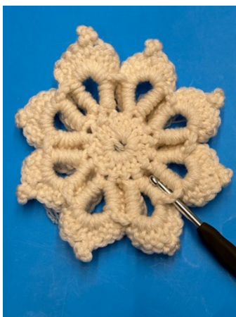
(FOTO 5) retro con particolare degli archi (n.8) che si sono creati con la lavorazione del fiore e che andranno utilizzati per la realizzazione della MATTONELLA